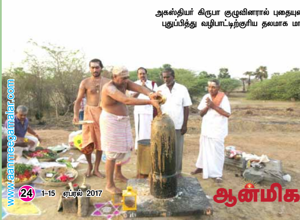
அகஸ்தியர் கிருபா குழுவினரால் புதையுண்ட கோவில்களை மீட்டெடுத்து புதுப்பித்து வழிபாட்டிற்குரிய தலமாக மாற்றும் பணி நடைபெறும்போது

AGASTHIYA KIRUPA, Tamil Nadu -INDIA. Contact:+919894109686