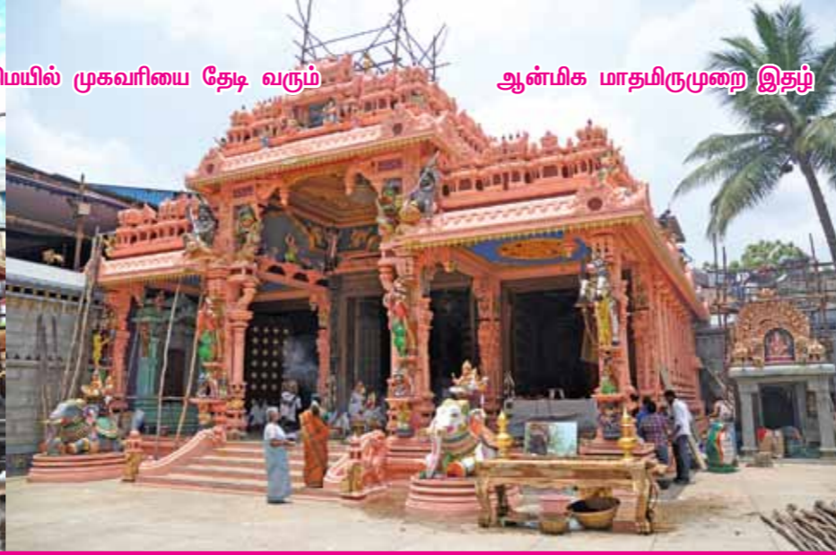
ஆன்மிக மாதமிருமுறை இதழ்